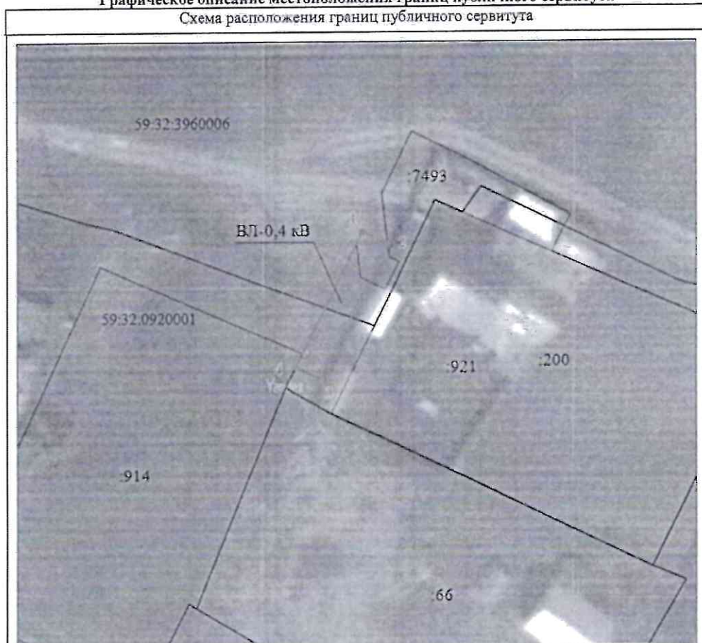
Графическое описание местоположения границ публичного сервитута Схема расположения границ публичного сервитута